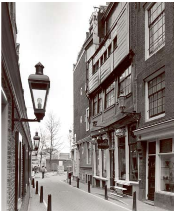
Het Aepgen aan de Zeedijk.

Thijs Boers conservator t.boers@opsolder.nl