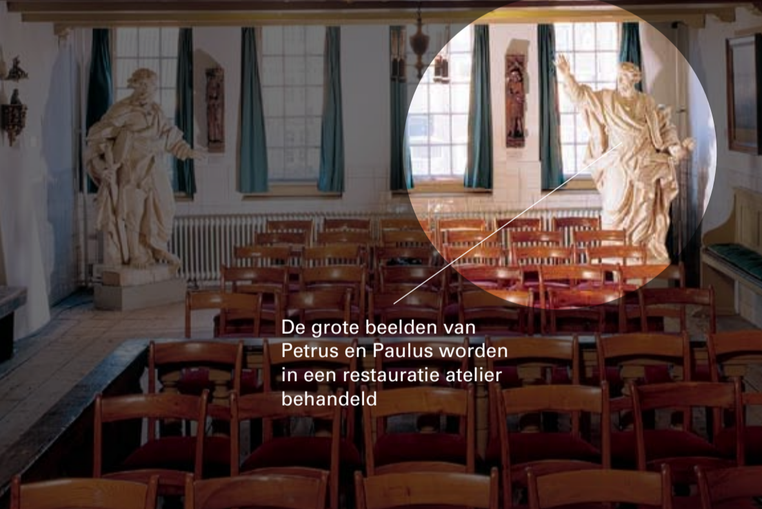
De grote beelden van Petrus en Paulus worden in een restauratie atelier behandeld