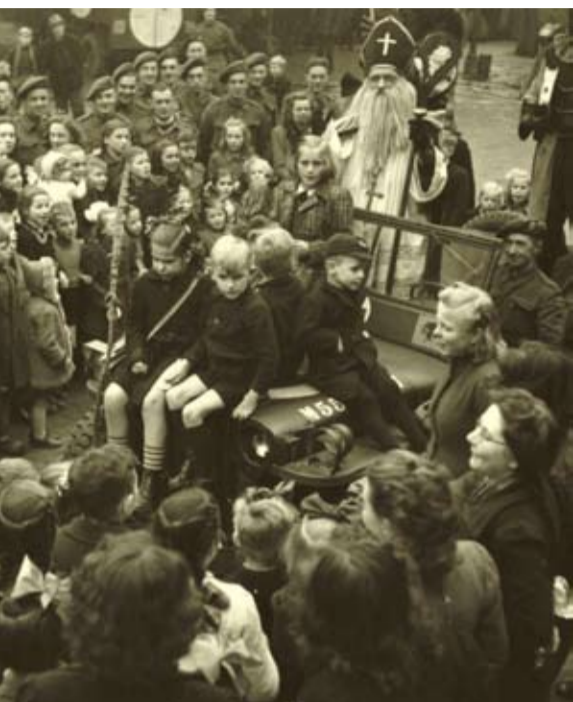
Sinterklaas in bevrijd Deurne, december 1944

Dat Sinterklaasavond zelfs in zware tijden wordt gevierd, is dit najaar het onderwerp van een samenwerkingsproject tussen het Nederlands Instituut voor Oorlogsdocumentatie (NIOD) en Museum Ons' Lieve Heer op Solder. In de gedichtenbundel Zou de goede Sint wel komen... Sinterklaasgedichten uit de Tweede Wereldoorlog (Uitgeverij Balans, oktober 2009) verzamelde NIOD-onderzoeker Hinke Piersma gedichten van particulieren tegen de Duitse bezetting, de Jodenvervolgving en over de bevrijding.