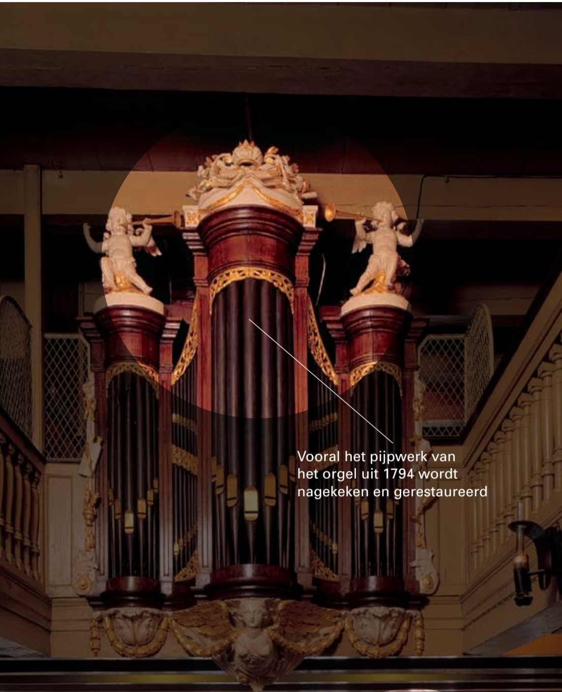
Vooraf het pijpwerk van het orgel uit 1794 wordt nagekeken en gerestaureerd