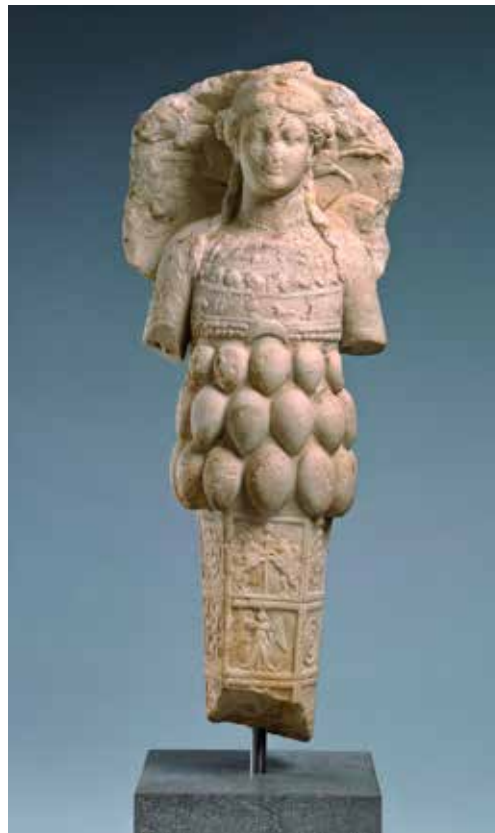
Buste van een cultusbeeld van Artemis van Epheseca. 100 v. Chr., h. 68,5 cm

Deze tentoonstelling is een verrassende zoektocht naar de vrouwelijke kanten van God. Er wordt een breed scala getoond van vrouwelijke idolen en godinnen uit het oude Nabije oosten – van 6000 v. Chr. tot aan het begin van onze jaartelling. De tentoonstelling is ontwikkeld door het BIBEL + ORIENT Museum in Freiburg (Zwitserland). Het FemArtMuseum heeft deze bijzondere collectie van ruim 200 beeldjes naar Nederland gehaald en toont deze in het Bijbels Museum te Amsterdam. Voor een bezoek aan de tentoonstelling geldt een toeslag van € 2,-.