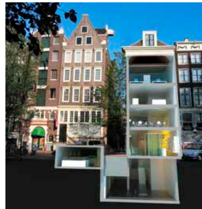
Afbeelding Claus en Kaan Architecten

De 'cultuur' van het bouwbedrijf sluit goed aan bij die van het museum. 'We verstaan elkaar goed. Wij zijn een zeer betrokken partij. We houden niet van half werk, dus we bereiden onze zaken tot in de puntjes voor. Als we iets aanpakken, gaan we er voor honderd procent voor. Dat kunnen we alleen maar doen als we samenwerken. Van het vechtmooi