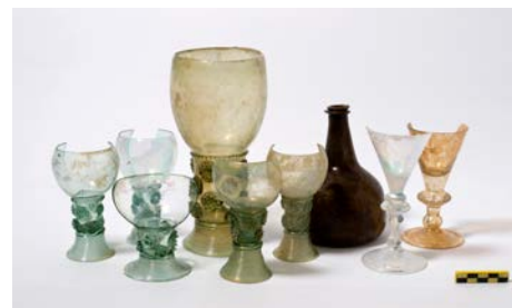
Vondsten beerput. Foto: BMA 2013

In Museum Ons' Lieve Heer op Solder is in de keuken een wc uit de 17e eeuw te zien. In 2013 werd, in het kader van funderingsherstel, de beerput onder dit privaat opgegraven en werden er allerlei ontdekkingen gedaan. Op zondag 25 juni geeft gemeentelijk archeoloog Ranjith Jayasena een lezing over de vondsten uit de beerput. 11.30-12.30 uur, kaarten te koop via de online ticketshop van het museum